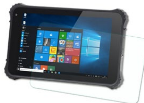
Защитная пленка на экран