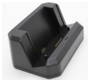
Док-станция для офиса