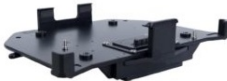
Док-станция для транспорта, RF Pass-Thru